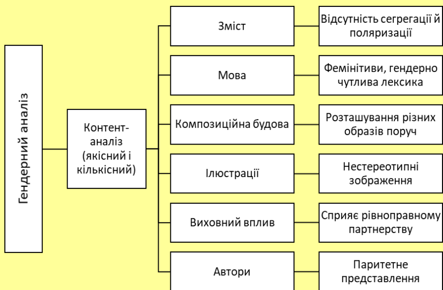
Рис. 1. Схема здійснення гендерного аналізу посібника

гендерні стереотипи. Тому робота над створенням навчальних матеріалів вимагає високого рівня гендерної компетентності від усіх членів колективу авторів і укладачів.